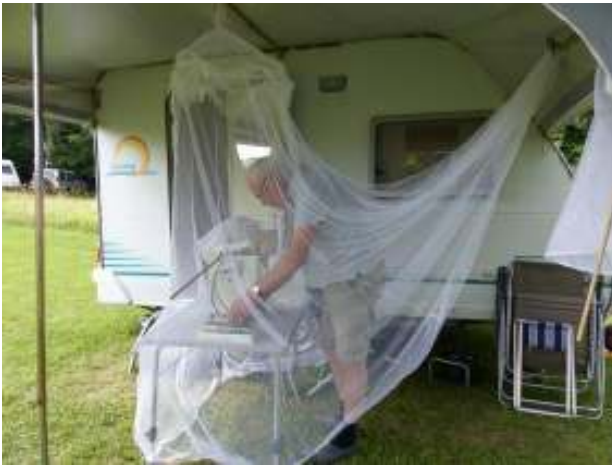
Vlinderval legen onder klamboe

lijsten hebben. Inmiddels heb ik op camping Lazy in Slowakije meer dan 200 soorten nachtvlinders waargenomen. De door mij gemaakte lijst is te vinden op de site van de camping. Ik heb mijn naam en e-mailadres onderaan de lijst staan met het gevolg dat ik wel eens een mailtje krijg van mensen die een soort hebben waargenomen, die niet op mijn lijst staat. De doelstellingen van de KNNV zijn: natuurstudie, natuurbeleving en natuureducatie. Het is fijn om deze doelstellingen ook tijdens je vakantie toe te passen.