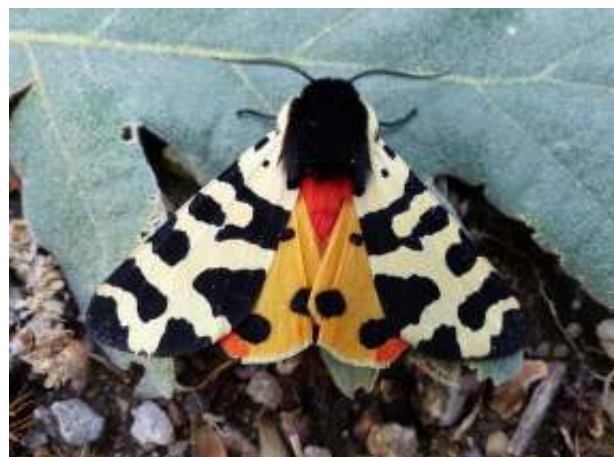
Beervlinder Arctia tigrina