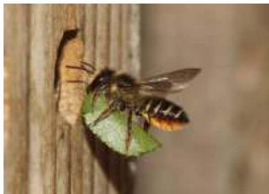
Tuinbladsnijder voor haar nestgang

Bijen zijn vegetariërs en voeden hun larven met stuifmeel als eiwitbron. In ons land komen naast de bekende honingbij, meer dan driehonderd soorten bijen voor. We noemen ze wilde bijen, omdat ze hier inheems zijn, dus "in het wild" voorkomen. De ruim twintig soorten hommels rekenen we ook tot onze wilde bijen. Zij vormen kolonies met vele dieren in één nest. De meeste inheemse bijen doen echter alles alleen en heten daarom solitaire bijen. Omdat ze ons niet steken en dus niet lastig zijn, zijn ze onbekend. Veel van deze soorten zijn gespecialiseerd op specifieke planten en worden door de negatieve invloed van de mens op de flora sterk bedreigd. De soorten zijn vaak genoemd naar hun uiterlijk of gedrag. Zo kunt u in uw tuin onder meer aantreffen: zandbijen, koekoeksbijen, wolbijen, bloedbijen, zijdebijen, enz. Daarnaast kennen we een zeker zo groot aantal angeldragende wespen, die ook alles alleen doen. Deze solitaire wespen voeden hun larven met vlees als eiwitbron. Vrijwel alle soorten zijn gespecialiseerd op bepaalde prooidieren als vliegen, rupsen, bijen, kevers en luizen. Ze maken of zoeken een kleine holte om daar een voorraad prooidieren op te slaan ten behoeve van hun nageslacht.