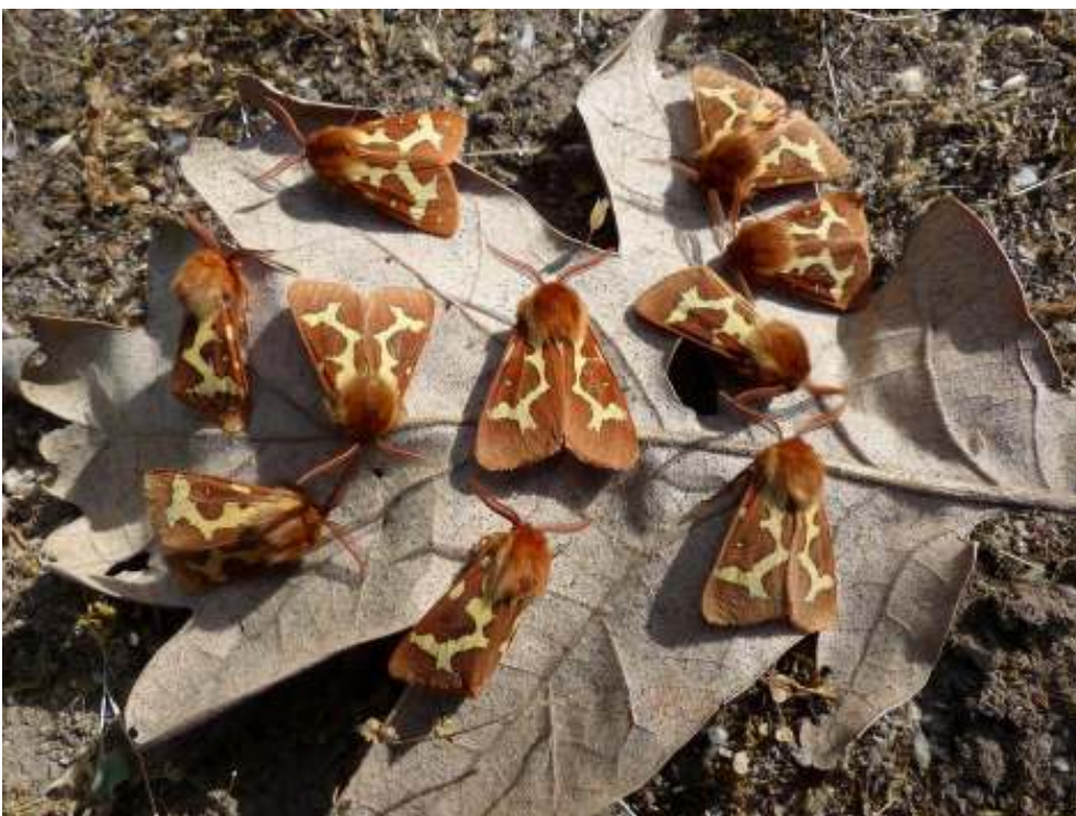
Beervlinder Hyphoraia dejeani