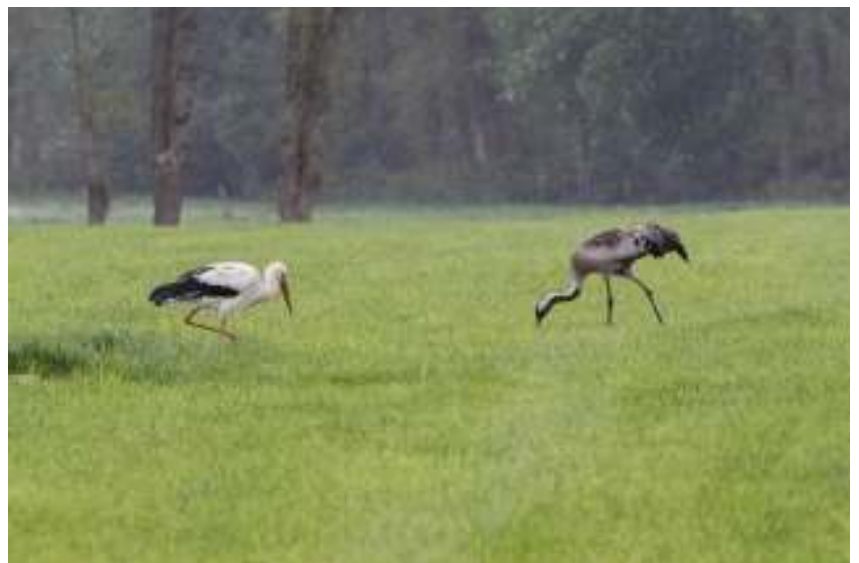
Ooievaar en kraanvogel, Dwingelderveld

Het is bijzonder dat een vogelwerkgroep al zoveel jaar een weekend organiseert. Dat er altijd weer organisatoren zijn die zich buigen over kaarten en alles tot in de puntjes regelen. Dat er altijd weer chauffeurs genoeg zijn. En dat er elke keer weer zoveel leden mee willen. Hulde aan allen die door de jaren heen hun schouders eronder gezet hebben en naar we hopen nog zullen blijven zetten.