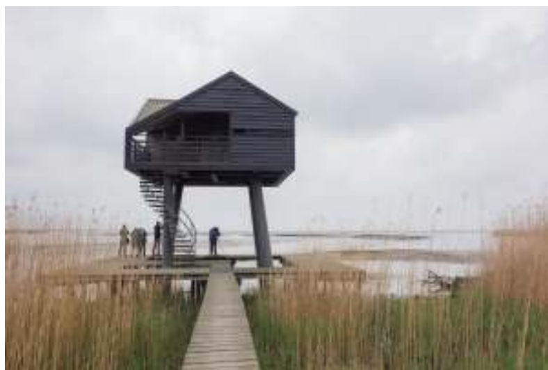
De Kiekkaaste

En op de terugweg in Drenthe: de Onlanden en het Dwingelderveld.