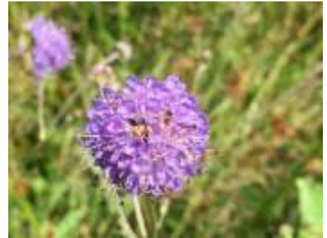
Blauwe knoop

Ondanks het feit dat het ook in het Beekbergerwoud relatief droog was - de meeste plassen zijn net als in 2018 ook dit jaar vrijwel geheel drooggevallen - houdt de lemige bodem kennelijk voldoende vocht vast voor het goed gedijen van de vegetatie.