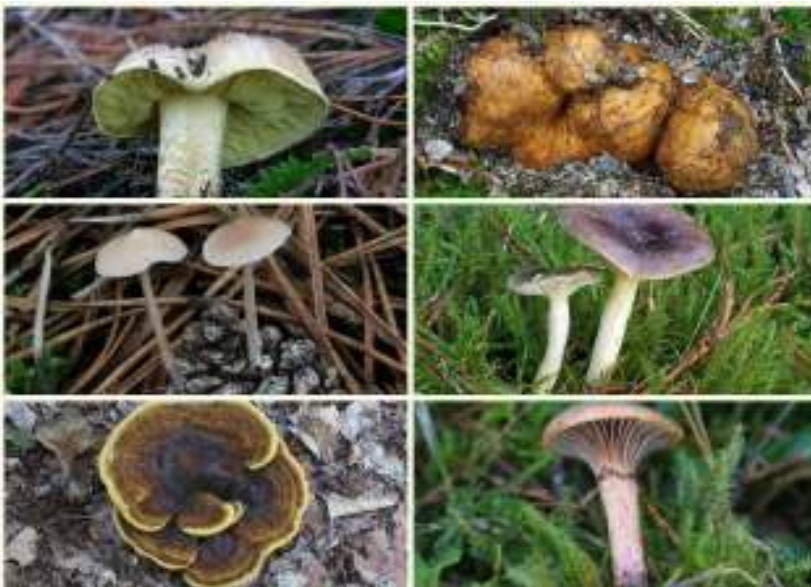
Opvallende paddenstoelen bij Grove den

Van links naar rechts, van boven naar beneden: