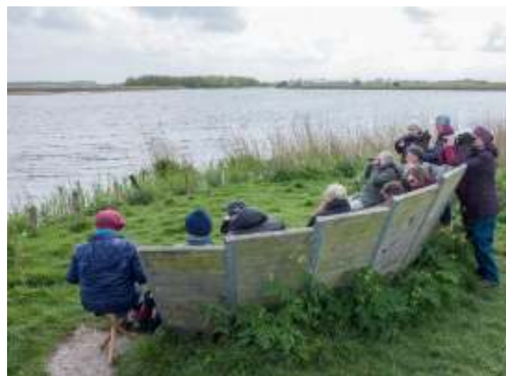
Ezumakeeg 2019