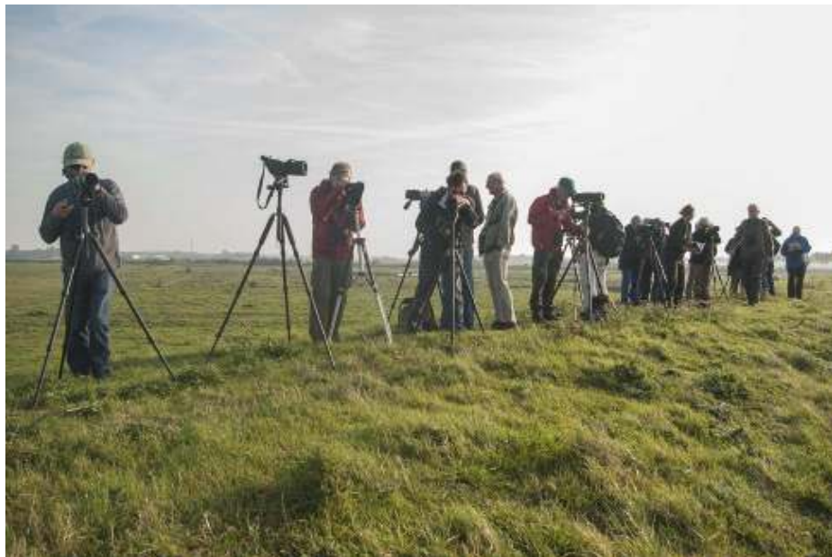
Vogelweekend oktober 2014

De meeste jaren werd het weekend eind april georganiseerd. Twee keer begin oktober. En het jubileumweekend (100 jaar KNNV afdeling Apeldoorn) naar de Eifel voor de gehele afdeling was in mei.