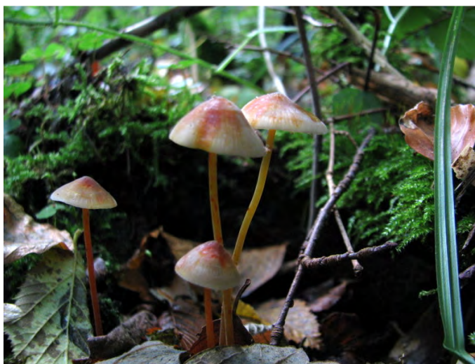
Prachtmycena, Eifel

Marian Poppema, Contactpersoon Paddenstoelenwerkgroep