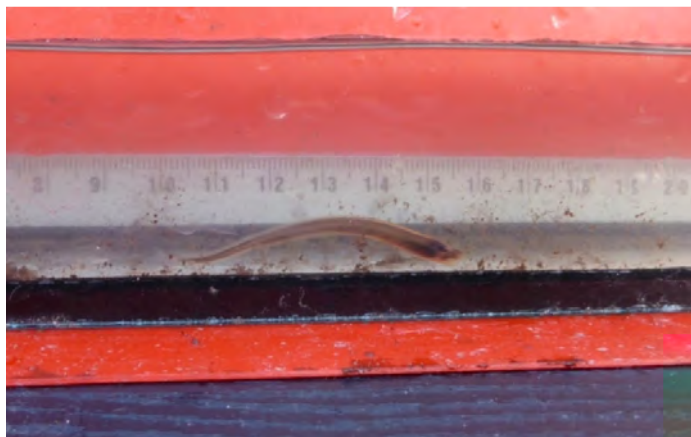
Beekpriklarve in cuvet

De bestaande macrofauna-activiteiten werden voortgezet.