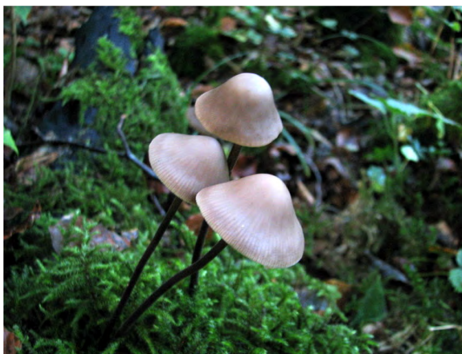
Knoflooktaailing; foto: Marian Poppema