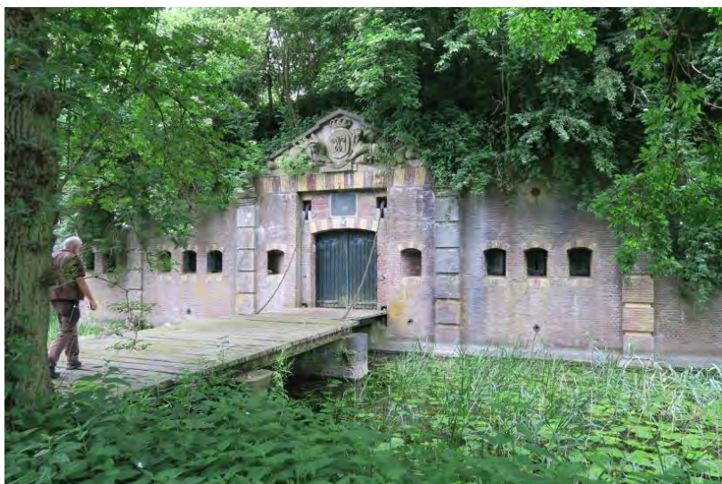
Fort Rhijnauwen

Overzicht evenementen in 2016 georganiseerd door de activiteitencommissie: