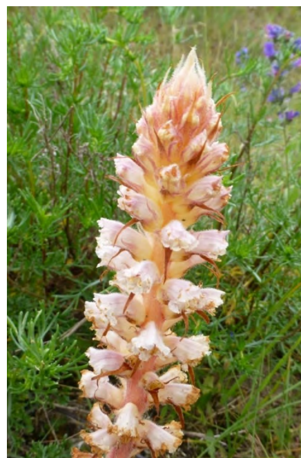
Orobanche picridis, bitterkruidbremraap; foto: Marchien van Looij