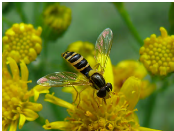
Langlijffe, een zweefvlieg, Apeldoorn

Daarnaast werden door meerdere leden ook het afgelopen jaar weer diverse inventarisaties uitgevoerd op verzoek van onder meer de Vlinderstichting, de werkgroep Vlinderfaunistiek van EIS, Staatsbosbeheer, Hoge Veluwe, Kroondomein, Geldersch Landschap en Natuurmonumenten. Het gaat daarbij om dag- en nachtvlinders, libellen, sprinkhanen en andere insecten, maar ook om reptielen. Het aanleveren van gegevens aan de betreffende organisaties is het primaire doel van deze inventarisaties, maar voor ons is de natuurbeleving hierbij zeker even belangrijk. Ook aan het lieveheersbeestjesproject van EIS werd vanuit Apeldoorn een substantiële bijdrage geleverd.