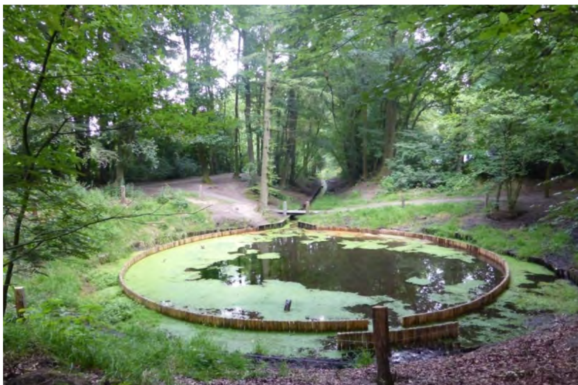
De kop van de Rode Beek