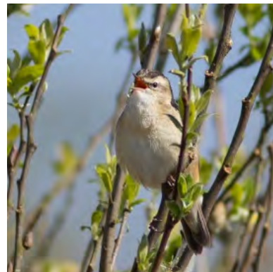
Rietzanger; foto: Evelien Schermer

De coördinatie van de Weidevogelbescherming