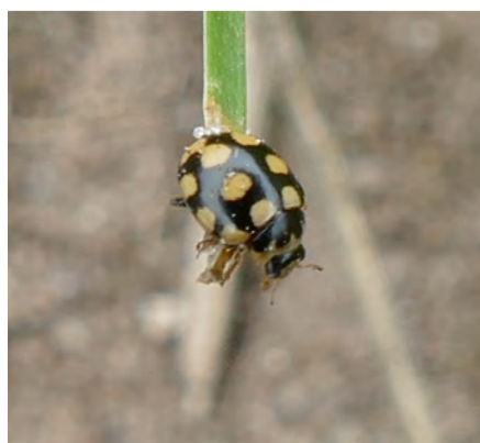
14-vlek lieveheersbeestje – Meinweg