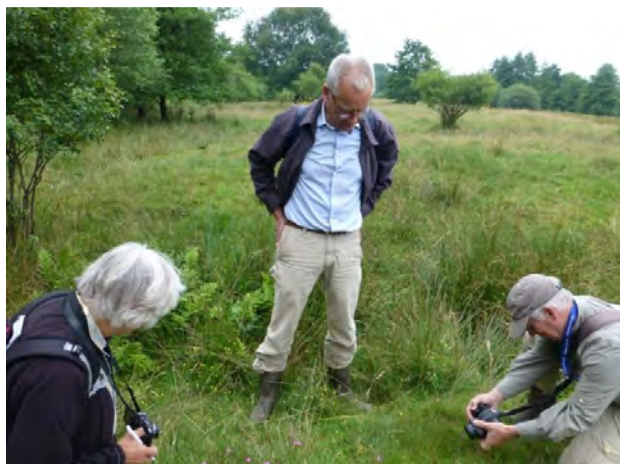
Leden plantenwerkgroep, Junner Koeland; foto: Marchien van Looij

Marchien van Looij Coördinator Plantenwerkgroep