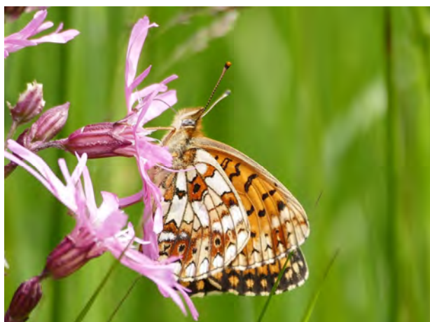
Zilveren Maan – Weerribben

Die zelfde nachtvlinders werden zoals bekend ook gemonitord in het "Licht op natuur" onderzoek in het Deelerwoud. Het is nog onduidelijk of 2016 het laatste jaar was voor dit project of dat het nog doorloopt in 2017. Het is weliswaar een interessant project, maar het vraagt wel steeds weer een behoorlijke tijdsinvestering van de betrokken leden.